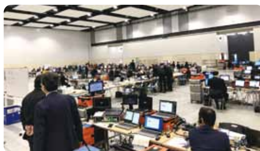
テクノホールの配信基地