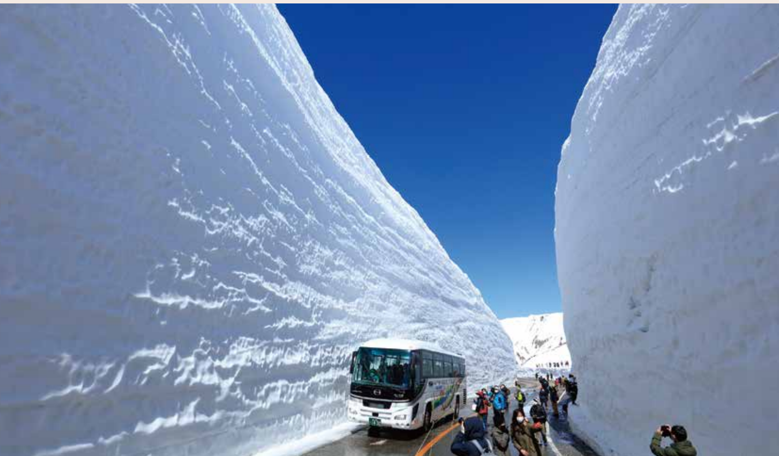
立山黒部アルペンルート・雪の大谷

TOYAMA, JAPAN Nature & Energy Lead to New Discoveries