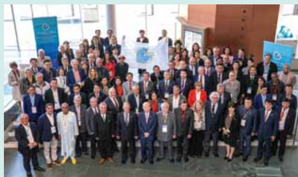
10月 世界で最も美しい湾クラブ世界総会