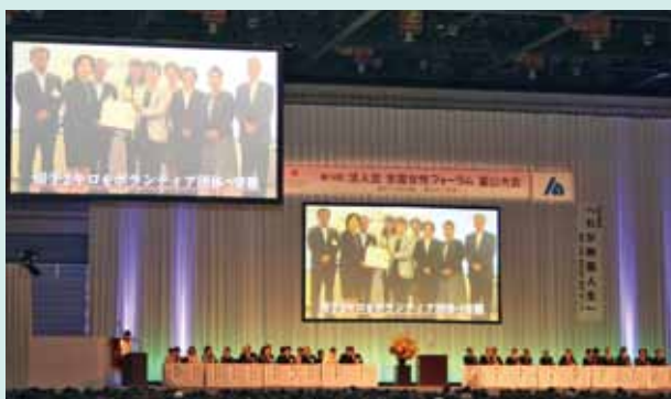
4月 法人会全国女性フォーラム富山大会

主なコンベンションとして、全国レベルでは「法人会全国女性フォーラム富山大会」、「日本青年会議所全国大会」等の大規模大会、学術会議は「日本栄養改善学会学術総会」、「日本原子力学会」等、また、国際会議は日本初開催の「NCM2019」や「世界で最も美しい湾クラブ世界総会」などが開催されました。